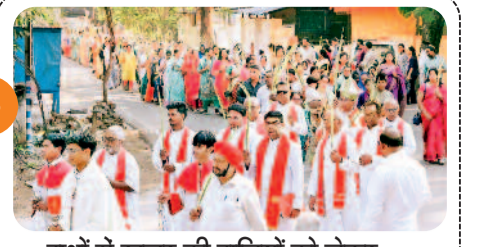
हाथों में खजूर की डालियों को लेकर ....