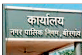
कार्यालय नगर पालिका निगम, बीरगांव

बजट भी करीब 150 करोड़ का ही पेश किया गया था। इस साल के बजट में स्ट्रीट डॉर्म्स के साथ ही नई टर्किंगों के निर्माण सहित ऑक्सीजोन की सुविधा देने का वादा महापौर बजट सत्र में करने वाले हैं।